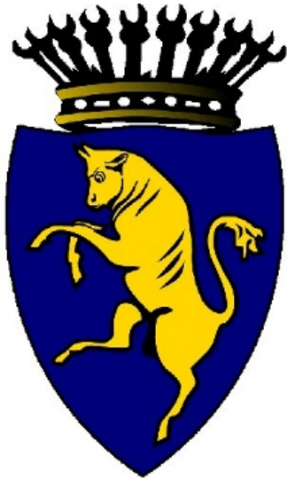
Comune di Torino