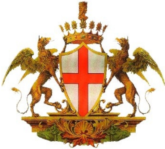
Comune di Genova